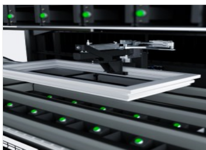
Table de montage des ferrures équipée de deux stations de vissage indépendantes pour travailler simultanément sur deux côtés du cadre, avec la possibilité d'insérer également un troisième chargeur pour les vis spéciales.