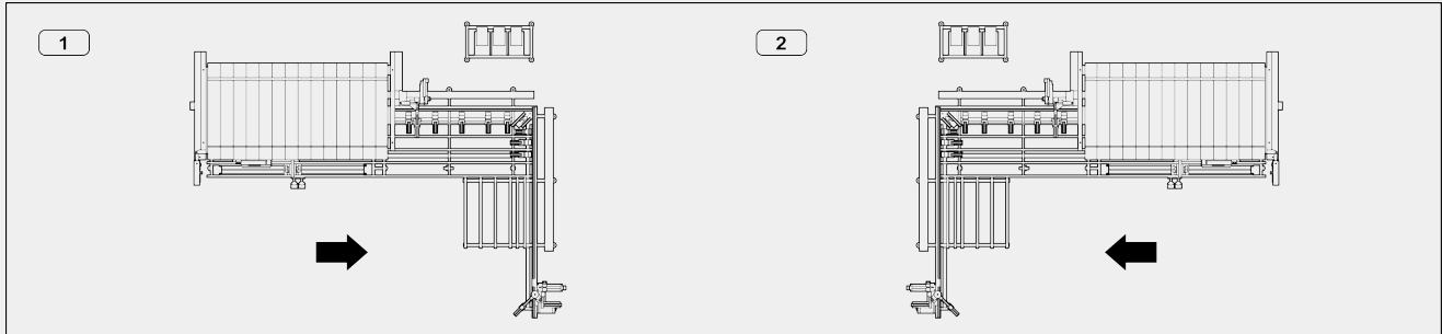
1 - 左侧版 (从左向右)