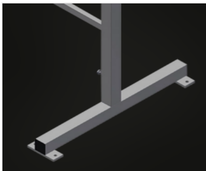
高度可调 高度可在850 – 1.000 mm之间调节